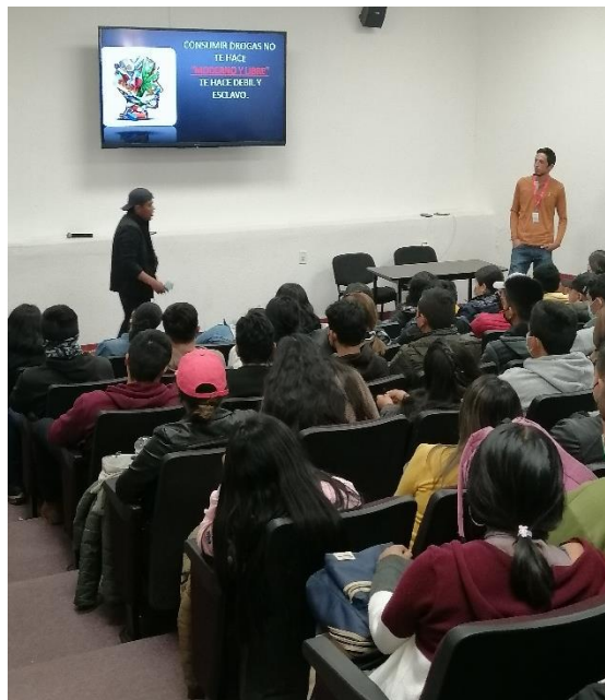
Evidencia 3 Campaña de salud “bienestar integral” en medios digitales