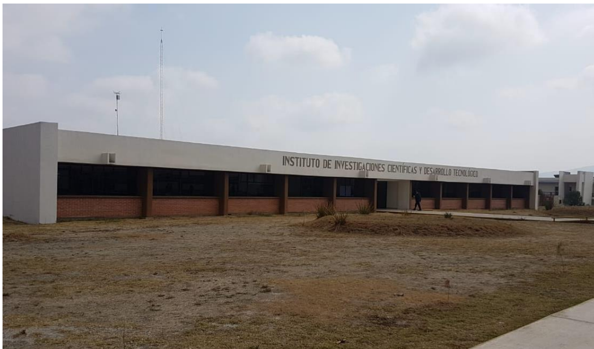
Foto 11. Edificio “Instituto de Investigaciones Científicas y Desarrollo Tecnológico”.