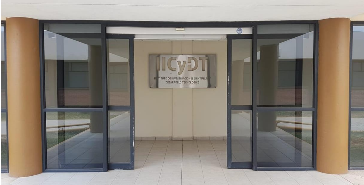
Foto 12. Acceso al edificio “Instituto de Investigaciones Científicas y Desarrollo Tecnológico”.