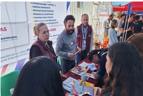
Feria Vocacional Cuauitepec