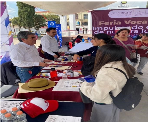
Feria Vocacional CBTIS 179