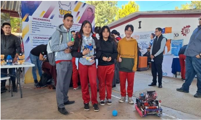
Feria Vocacional COBAEH Tulancingo