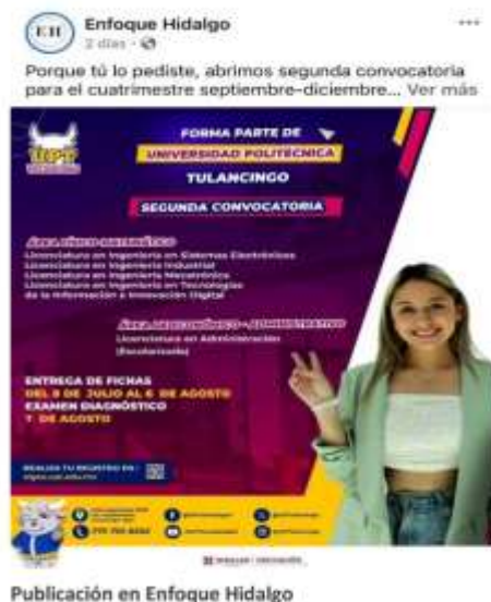
Publicación en Enfoque Hidalgo

Se publican de manera mensual en los medios electrónicos institucionales, en los cuales se informa sobre las actividades institucionales que se realizan, así como los periodos de inscripciones dentro de nuestra campaña de captación de alumnos.