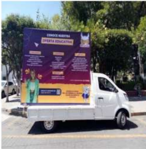
Publicidad con Perifoneo