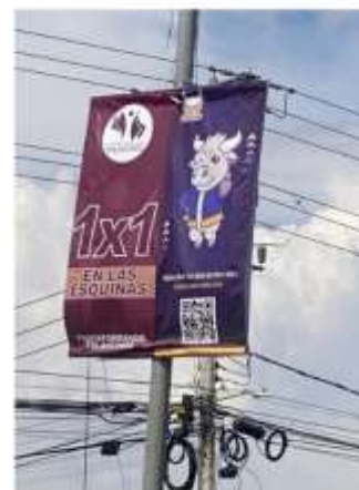
Pendones Puente la Preferida